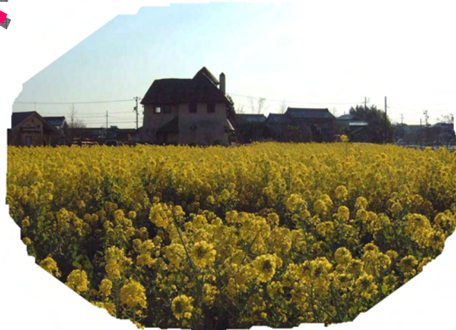
さっぽろ道を背景に前面に広がる『なのはな畑』 豊川市豊津町