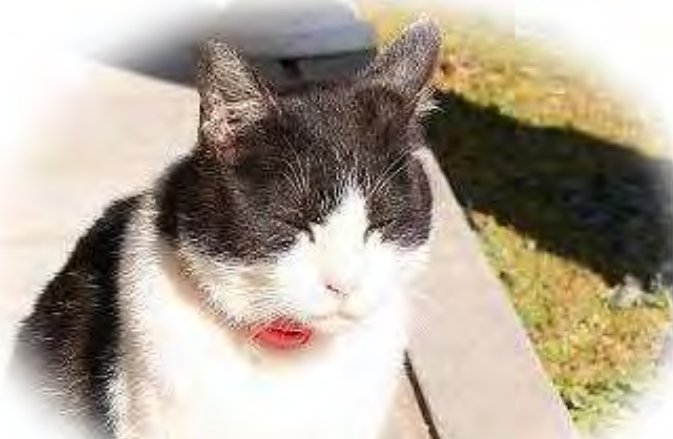
ミーちゃん メス ミックス 6歳 (推定)

「ノラ猫だった私をご主人様は大切に育ててくれています。ご主人様はお店をやっておりますので、それはもうあふれんばかりの喜びを表現してお客様におもてなししております。まあ「ねこの恩返し」ってところですか・・・私は「待て」と「フセ」が出来るんですよ。