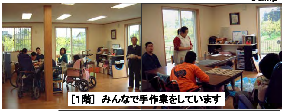
[1階] みんなで手作業をしています