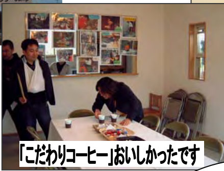
「こだわりコーヒー」おいしかったです

[2階の事務所] 2階に柵？ いずれ、建て増しを計画しているとの事で、入浴の施設を設ける計画も...今は、危ないので柵で囲ってあるんです。