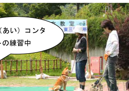
眼（あい）コンタクトの練習中