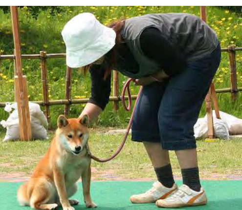
クルミちゃん メス