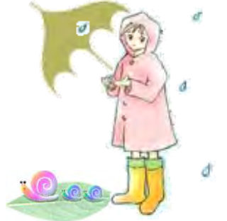
梅雨明け 過去3年間データ 7月24日

保湿効果でお肌もしっとり 洗顔料やハンドクリームに数滴のハチミツを混ぜて使うと殺菌効果で肌を清潔に保ち、保湿効果でお肌がしっとり、つややかになります。