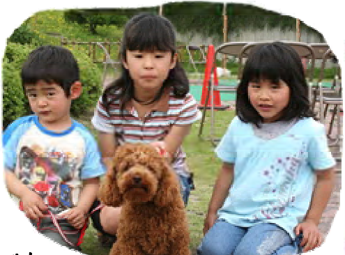
愛犬と参加してくれたお友達