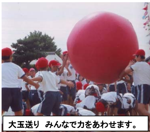
大玉送り みんなで力をあわせませす。