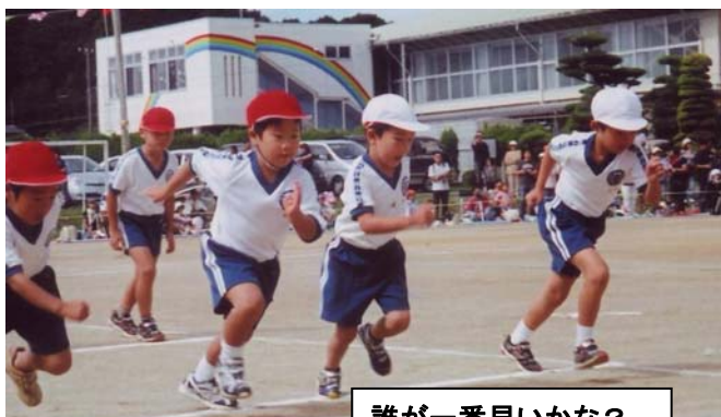
誰が一番早いかな？