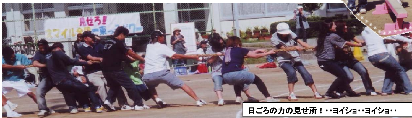
日ごろの力の見せ所！・・・ヨイショ・・・ヨイショ・・・