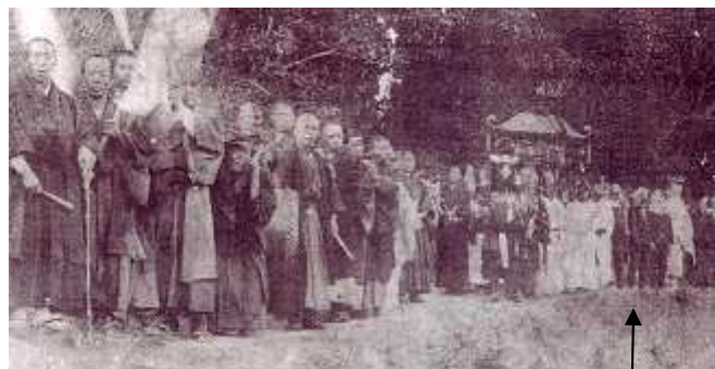
大正年間 二宮様へ向かう途中の記念撮影、右端鬼 3 匹