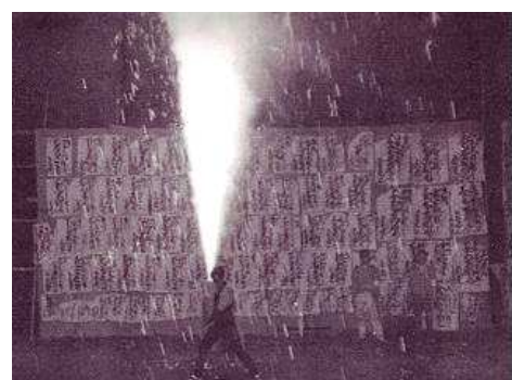
昭和 48 年頃 手筒煙火奉納

上長山町は、上地区 若宮八幡神社（4月第3土・日）・中地区 素盞鳴神社（4月第1土・日）・下地区 白鳥神社（10月第2土・日）東山地区 東山神社（3月第4土・日）と大きく四つに分かれております。