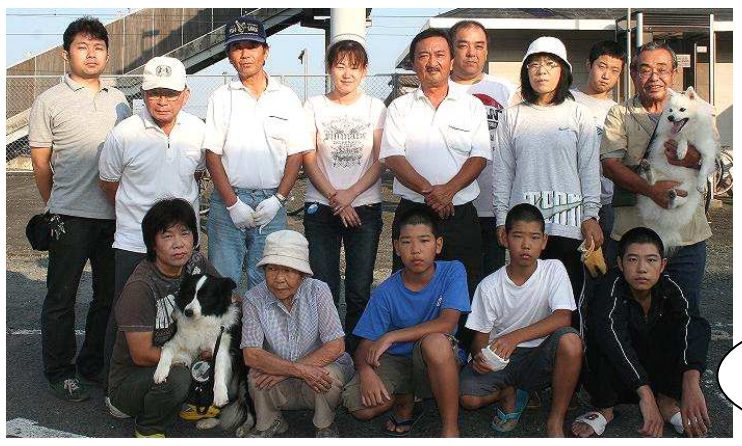
次回のまちをきれいに