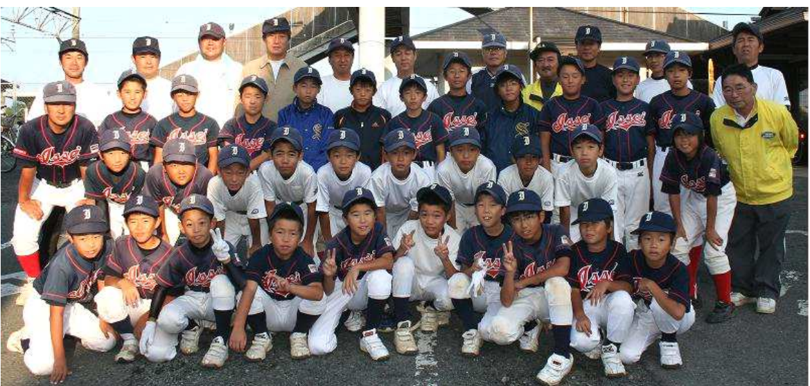
一西シャークスの皆さん！！いつも あ・り・が・と・う！！

朝早くから、こんなに大勢の方に集まって頂き 感謝！！感謝！！です。 あら・ら・監督さん達まで・ ありがとうございます！ ご協力いただきました皆様！いつも ありがとうございます！