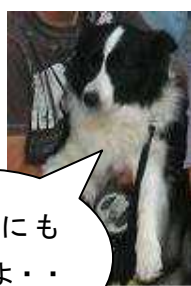
私たちにも 会えるよ・

次 回：11月1日（日） 時 間：6:30～（雨天中止） 場 所：JR飯田線三河一宮駅周辺 ※清掃用具はこちらで用意します