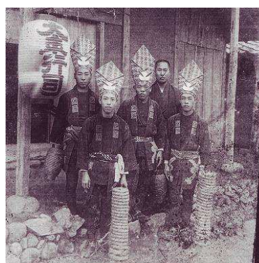
大正 10 年頃の写真