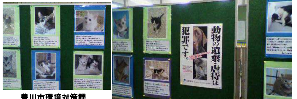
豊川市環境対策課