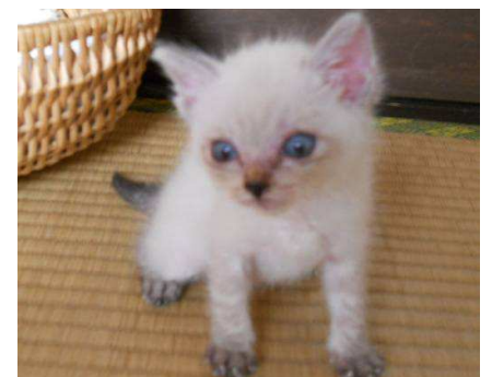
⑤オス シyam Mix