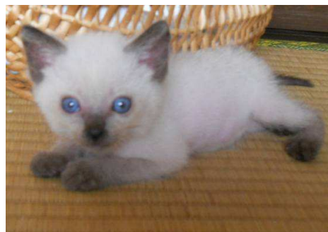
②オス シyam Mix