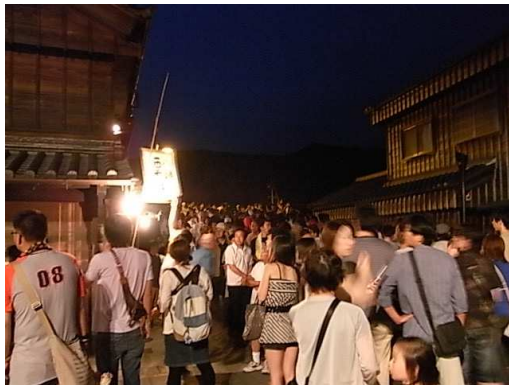
朔日餅を求めて長蛇の列です

大変お疲れ様でした。次回は来年の5月1日（日）を予定しています。是非ご参加下さい。店主