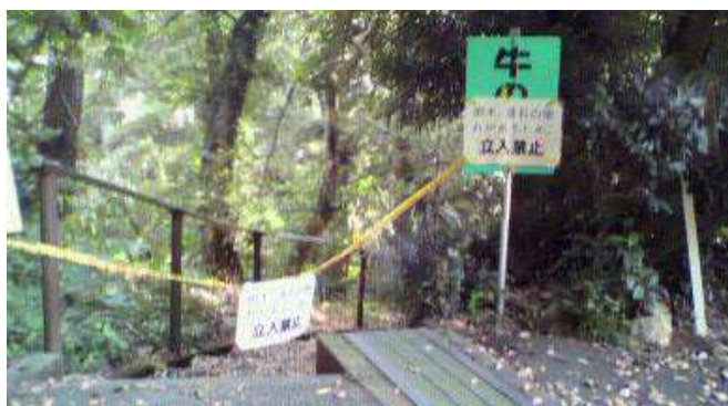
現在の【牛の滝】の出入り口です。

また、来年までには補修するそうですので、それまでは絶対に立ち入りしないようお願いいたします。